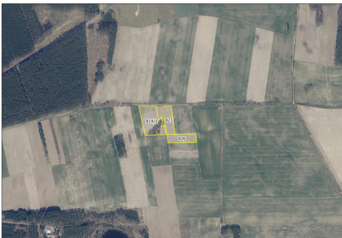
Rys. 1. Widok ogólny na działkę inwestycyjną nr 823, 826, 814/1 obręb Bledzew gm. Bledzew

Teren zadrzewienia został wyłączony z obszaru przeznaczonego pod inwestycję. Zatem w wyniku realizacji przedmiotowego przedsięwzięcia nie zajdzie konieczność usuwania drzew ani krzewów