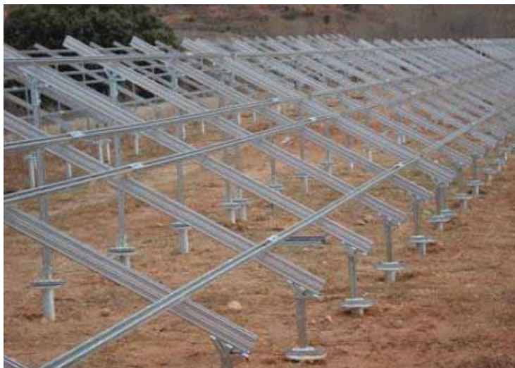
Ramy podtrzymujące panele fotowoltaiczne

„Budowa instalacji fotowoltaicznej o mocy do 3 MW wraz z infrastrukturą towarzyszącą na działce o nr 823, 826, 814/1 obręb Bledzew. Jednocześnie przewiduje się wyznaczenie wjazdu na działkę z pobliskiej drogi sąsiadującej dz. 816 i 813 obr. Bledzew, a także realizację dróg wewnętrznych i placów manewrowych. Na obecnym etapie procedury dopuszcza się możliwość zastosowania urządzeń o mocy znamionowej panelu ( P_{max} ) wynoszącej 280 Wp lub wyższej, a co za tym idzie zastosowanie do około 3700 szt. paneli w odniesieniu do 1 MW. Łączna ilość paneli będzie wynosić do 29600 szt. W przypadku zastosowania paneli charakteryzujących się jednostkową mocą > 280 Wp, ilość paneli będzie mniejsza (będzie się ona kształtować od 280 do 1000 Wp/panel). Ogniwa fotowoltaiczne zamontowane zostaną w sposób nieinwazyjny (bez dewastacji terenu i wykonywania wykopów budowlanych), metodą nabijania lub wkręcania profili aluminiowych lub stalowych bezpośrednio do gruntu.