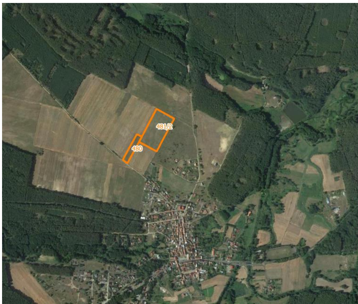
Rys. 1. Widok ogólny na działkę inwestycyjną nr 480, 481/2 obręb Bledzew gm. Bledzew

Powierzchnia działki 480 wynosi 0,7635 ha, pow. działki 481/2 wynosi 3,46 ha. Łączna powierzchnia ww. działek wynosi 4,2235 ha. Teren przeznaczony pod inwestycję wynosić będzie do 4,0 ha, przy czym będzie to powierzchnia zabudowy, przez którą rozumie się powierzchnię terenu zajęłą przez obiekty budowlane oraz pozostałą powierzchnię przeznaczoną do przekształcenia, także tymczasowego, w celu realizacji przedsięwzięcia.