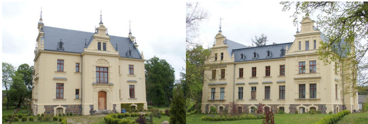
Zdjęcia nr 22, 23. Pałac w Nowej Wsi (nr 85)

Pałac i zabudowania zespołu folwarcznego, powstałe w 2 poł. XIX w. i na początku XX w., usytuowane są na południowym skraju wsi. Od strony północy i zachodu pałac otacza park, a całość odgradza od budynków gospodarczych i zabudowań wsi kamiennie - ceglany mur z dwoma bramami.