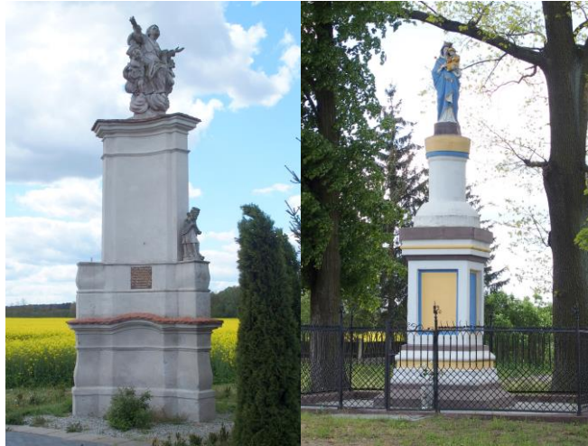
Zdjęcia nr 38, 39. Figury wolnostojące z terenu gminy Bledzew

Figura na cmentarzu wojennym, ul. Starodworska w Bledzewie (zdjęcie nr 34) - kamienna figura z 1811 r., wieńcząca wysoką kanelowaną kolumnę, ustawiona w na miejscu dawnego cmentarza wojennego. Stojąca Matka Boska (orantka), ukazana w długiej sukni, z długim płaszczem nałożonym na ramiona i z dłońmi uniesionymi do góry. Dookoła głowy aureola z ośmiu gwiazdek. Kolumna Maryjna pochodzi z czasów kampanii napoleońskiej, a wzniesiono ją na mogile rosyjskich żołnierzy. W tym czasie funkcjonował w Bledzewie szpital urządzony przez miejscowych cystersów. Leczono w nim uczestników walk z wojskami napoleońskimi. Pod figurą spoczywa 87 rosyjskich żołnierzy - ofiar kampanii napoleońskiej.