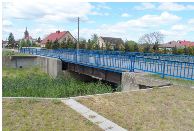
Zdjęcie nr 28. Most przechylno - przesuwny K804 na rzece Obrze w zespole Międzyrzeckiego Rejonu Umocnionego w Bledzewie

Most przechylno - przesuwny K804 na rzece Obrze został zbudowany w latach 1935 - 1937. Stanowi on element fortyfikacyjny Międzyrzeckiego Rejonu Umocnionego. Jest to rolkowy most uchylno - przesuwny o symbolu K804, ulokowany na nieukończonym kanale fortecznym Obry. Różni się od mostu właściwego ułożoną z grubych dębowych desek (dyli) nawierzchnią. Po zwolnieniu rygli przęsło mostu pod własnym ciężarem przechylało się, a następnie przetaczało w tył, chowając do komory pod jezdnią. Maszynownię ukryto w specjalnym schronie ze stanowiskiem obserwacyjnym, do jego obsługi wystarczał jeden człowiek. Na drodze przed mostem umieszczono szlaban przeciwpancerny oraz bariery z szyn kolejowych. Most zachowany jest do dziś w dobrym stanie, ale pozbawiono go możliwości ruchu murując pod przęsłem filary podtrzymujące. Wokół mostu fortecznego znajdują się drewniane bale wbite w ziemię stanowiące dodatkową zapórę przeciwpancerną (tzw. zęby hipopotama).