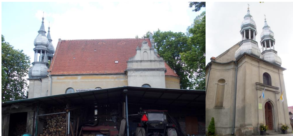
Zdjęcia nr 14, 15. Kościół ewangelicki, ob. filialny rzymskokatolicki pw. św. Józefa w Starym Dworku

Stary Dworek miał kiedyś kościół pw. Wniebowzięcia NMP. Niestety w księgach biskupich i konsytorskich z XV i XVI w. nie ma o nim żadnej wzmianki. Niewiadomo czy spotykane raz po raz Antiqua Qaria dotyczy Starego Dworu klasztoru Paradyskiego czy też Starego Dworku klasztoru bledzewskiego. Nie ma też tej parafii w Liber Beneficiorum. Wspomina o niej rejestr z 1580 r. W wizytacji z 1603 r. podano inwentarz kościoła z 1580 r. i wspomniano o roli kościelnej i mesznem plebani. Po 1603 r. a przed 1640 r. został filią kościoła w Bledzewie. Wieś ta od 1232 r. stanowiła posiadłość klasztoru cystersów, a od 1560 r. stała się siedzibą opatów bledzewskich.