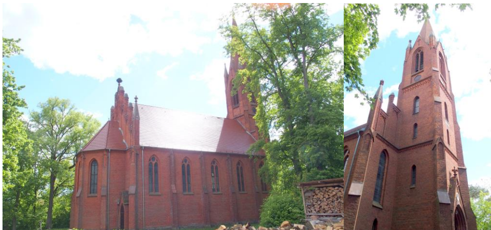
Zdjęcia nr 3, 4. Kościół ewangelicki, ob. filialny rzymskokatolicki pw. Niepokalanego Poczęcia NMP w Chycinie