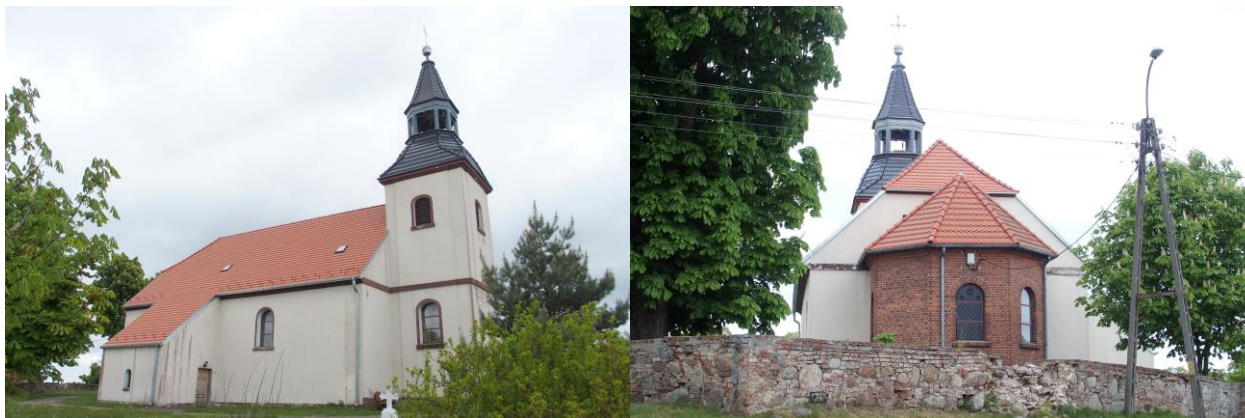
Zdjęcia nr 8, 9. Kościół filialny pw. św. Mikołaja w Osiecku

Kościół wznosi się pośrodku tzw. zawisia, na kilkumetrowym wzniesieniu. Jest to kościół XIV-wieczny zbudowany w stylu późnogotyckim, przebudowany w XVIII w., w 1806 r. wybudowano wieżę. Budynek murowany z granitu narzutowego i cegły na zaprawie wapiennej, tynkowany, wieżowy. Kościół jednonawowy, na planie prostokąta z pięcioboczną absydą - prezbiterium i kwadratową, neogotycką wieżą od zachodu. Przy nawie od północy prostokątna zakrystia. Korpus nakryty dwuspadowym dachem z naczółkiem, absyda pięciopółkolistym dachem namiotowym, zakrystia z dachem pulpitowym, wieża z ośmiobocznym hełmem z latarnią.