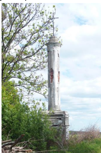
Zdjęcie nr 40. Kapliczka kolumnowa, Sokola Dąbrowa

Kapliczki kolumnowe - wysokie, kamienne kolumny lub wielokondygnacyjne struktury zwieńczone krzyżem lub figurą świętej osoby.