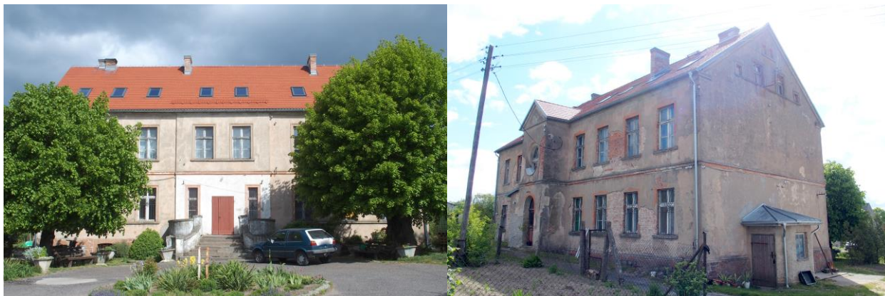
Zdjęcia nr 24, 25. Pałac w Osiecku (nr 65)

Pałac wraz z zabudową folwarczną i nieistniejącym dziś parkiem po północno - wschodniej stronie, znajduje się w centralnej części wsi, na wschód od kościoła. Fasadą zwrócony jest w stronę prostokątnego dziedzińca, przez który prowadzi dojazd do pałacu. Rozległy dziedziniec wyznaczają zabudowania gospodarcze, rozlokowane na jego skrajach.