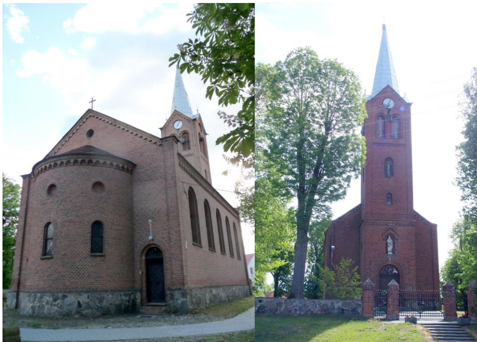
Zdjęcia nr 12, 13. Kościół ewangelicki, ob. parafialny rzymskokatolicki pw. Wniebowzięcia NMP w Sokolej Dąbrowie