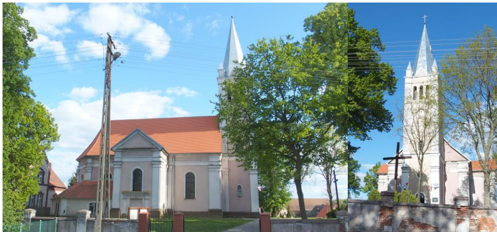
Zdjęcia nr 16, 17. Kościół ewangelicki, ob. parafialny rzymskokatolicki pw. Chrystusa Króla w Templewie

Pierwsze wzmianki na temat istnienia kościoła w Templewie pochodzą z przełomu XIV/XV w. Nowy istniejący do dziś kościół został zbudowany w 1798 r., poświęcony przez ks. Piotra Sąsiadka. Kościół murowany, jednonawowy, z węższym prezbiterium oraz transeptem od wschodu. Elewacje podzielone zostały pilastrami. Po stronie zachodniej wznosi się kwadratowa wieża, nadbudowana w 2 połowie XIX w., zwieńczona wieżyczkowymi sterczynami i ostrosłupowym, strzelistym hełmem.