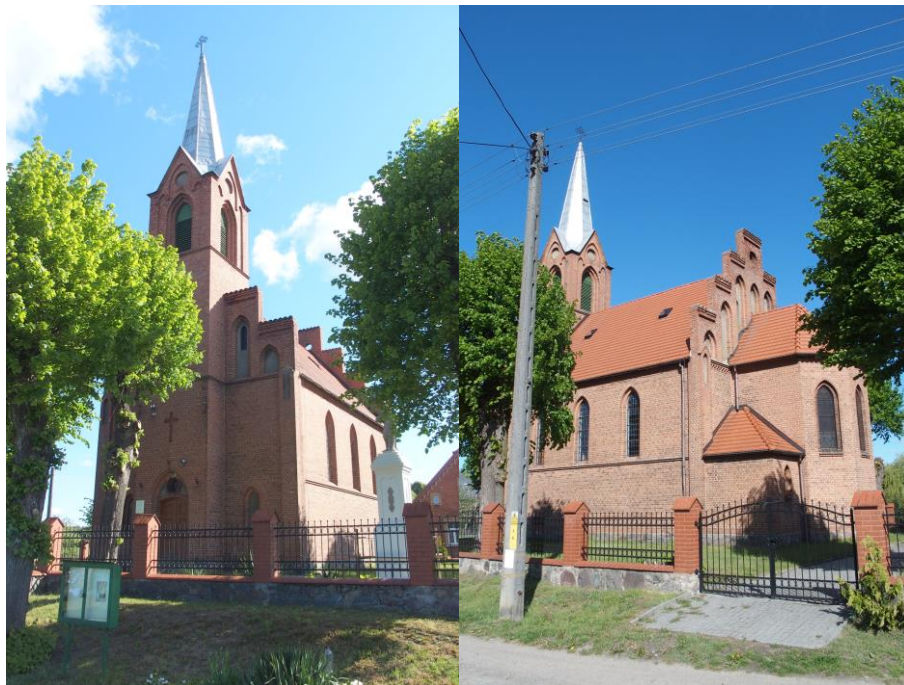
Zdjęcia nr 10. 11. Kościół parafialny pw. Jana Chrzciciela w Popowie

Popowo, wieś należąca do parafii bledzewskiej, otrzymał zakon OO. Cystersów w Zemsu od Waldemara i Jana margrafów brandenburskich w 1312 - 1315 r. Kościół parafialny niewiadomego tytułu, założono zapewne przy lokacji wsi w XIII albo XIV w.