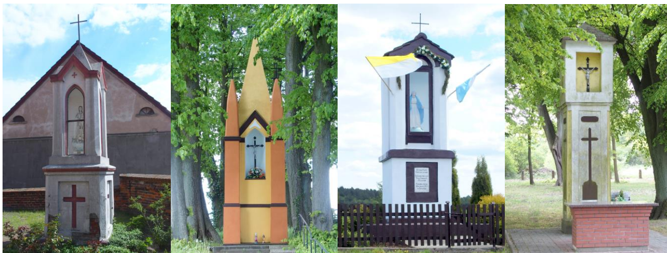
Zdjęcia nr 30, 31, 32, 33. Kapliczki latarniowe z terenu gminy Bledzew

Kapliczki latarniowe - mają formę czworoboku z prześwitami lub wnękami ustawionego na czworobocznym słupie lub okrągłej kolumnie, z płytkami, płaskorzeźbionymi wnękami, z wyodrębnioną ażurową latanią, nakryta daszkiem, często zakończona żeliwnym krzyżem, w środku znajduje się krzyż lub figurka. Ten typ kapliczek przypomina formą latarnie umarłych. Miejsce kaganków zapalanych nocą, z czasem zajęty figury świętych.