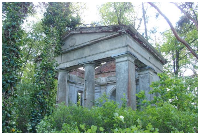
Zdjęcie nr 21. Kaplica grobowa Büttnerów, Goruńsko

Warto wspomnieć o kaplicy grobowej Büttnerów na cmentarzu rodowym w Goruńsku.