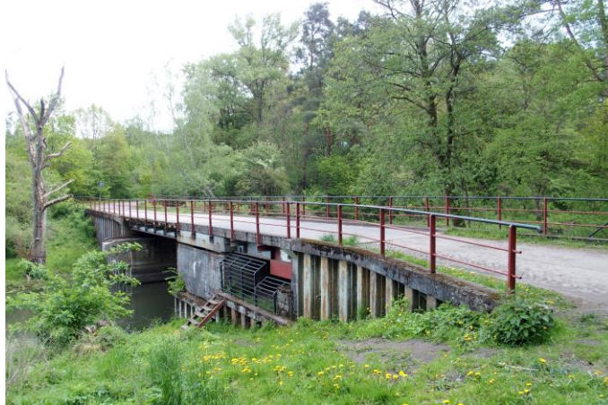
Zdjęcie nr 29. Most zwodzony - obrotowy D812 na Kanale Taktycznym 813 w Zespole Międzyrzeckiego Rejonu Umocnionego w Starym Dworku

Most w Starym Dworku o nazwie D 812, to jeden z dwóch mostów obrotowych w obrębie Międzyrzeckiego Rejonu Umocnionego. Ten rozbudowany system niemieckich fortyfikacji został stworzony w latach 1934 - 1944. Most jako jedyny w zespole MRU nie posiada przeszkód przeciwpancernych i schronów bojowych.