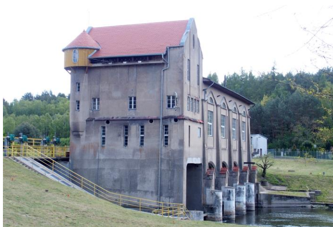
Zdjęcie nr 27. Elektrownia wodna w Bledzewie

Projekt budowy elektrowni przepływowej opracowała w 1905 r. berlińska firma Havested und Contag, specjalizująca się w budownictwie wodnym, służącym celom energetycznym. Inwestorem budowy była spółka, samorządowe zakłady okręgowe wielopowiatowe z o.o., występująca pod nazwą „Uberlandzentrale: Birnbaum-Moseritz und Schwerin A.G.” ok. 1909 r. Budowę stopnia wodnego i elektrowni rozpoczęto w 1906 r. Odbioru robót dokonano 15 maja 1911 r. i tę datę można uznać za początek działania elektrowni, chociaż rozruch zakładu i produkcji energii datuje się tutaj już od końca 1910 r.