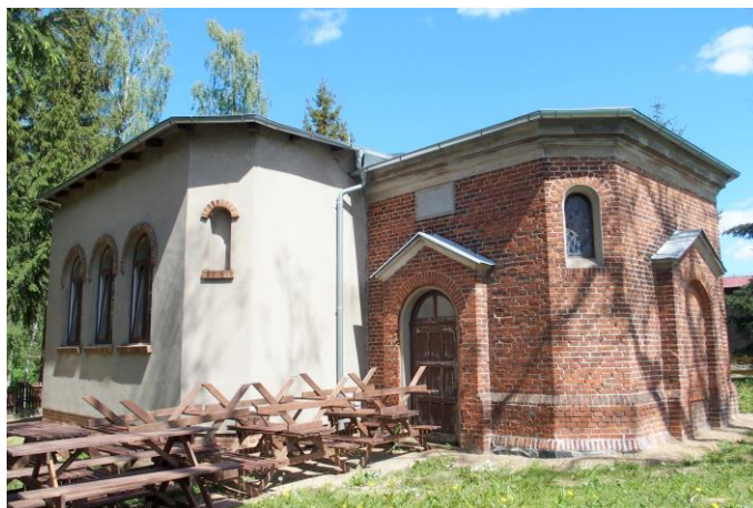
Zdjęcie nr 5. Kościół ewangelicki, ob. filialny rzymskokatolicki pw. MB Królowej Polski w Goruńsku