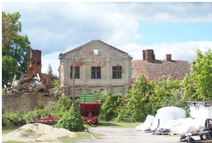
Zdjęcie nr 26. Rezydencja Opatów - dwór w Starym Dworku (nr 34)

Dwór położony jest w zachodniej części wsi, w sąsiedztwie zakola rzeki Obry, do której sięga park dworski. Dwór wraz z kościołem stojącym na nawsiu, pośrodku miejscowości, tworzy kompozycję osiową, niegdyś połączoną budynkiem wieży bramnej, rozebranej w początkach XX w. Wygląd wieży znany jest z opisu oraz skróconej inwentaryzacji wykonanej w 1903 r. Za dworem rozciągał się tarasowy ogród, przez co siedziba opatów w Starym Dworku urastała do rangi miniaturowej rezydencji reprezentacyjnej w typie entre cour et jardin , wzbogaconej bryłą kościoła.