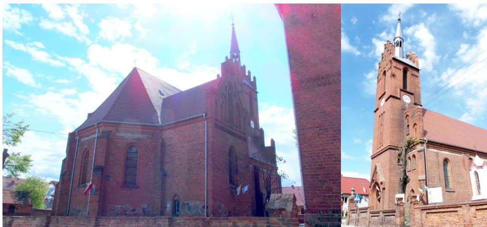
Zdjęcia nr 1, 2. Kościół parafialny pw. św. Katarzyny, ul. Kościuszki w Bledzewie

W 1212 r. wieś Bledzew, darował Cystersom ze Starego Dworku margrabia brandenburski Waldemar. Do Bledzewa przed 1418 r. przenieśli mnisi swą siedzibę z Zemsku i wtedy prawdopodobnie lokowali tam miasto. Dla kościoła parafialnego pw. św. Katarzyny, brak jest wszelkich materiałów w księgach biskupich i konsystorskich z XV i XVI w. Jest tylko nazwa tej parafii w Liber Benefitorium z 1510 r. oraz w rejestrze konstytucji z 1540 r. Kościół tutaj założono w XIV w.