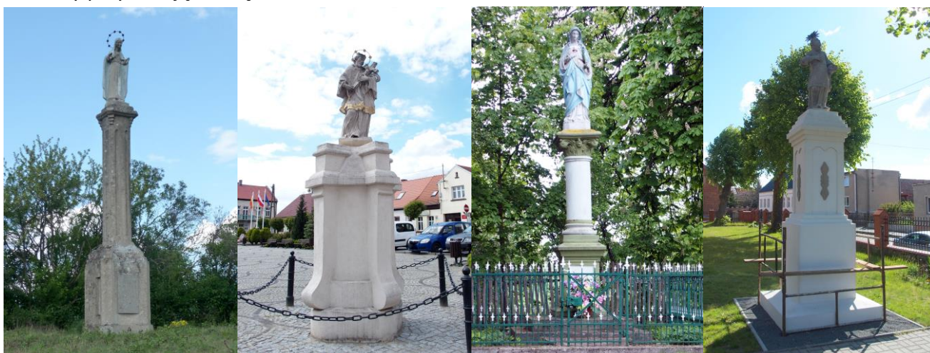
Zdjęcia nr 34, 35, 36, 37. Figury wolnostojące z terenu gminy Bledzew

Figury wolnostojące , czyli figury Chrystusa, Matki Bożej albo świętych ustawione na cokole. Niekiedy przybierają formę kolumn.