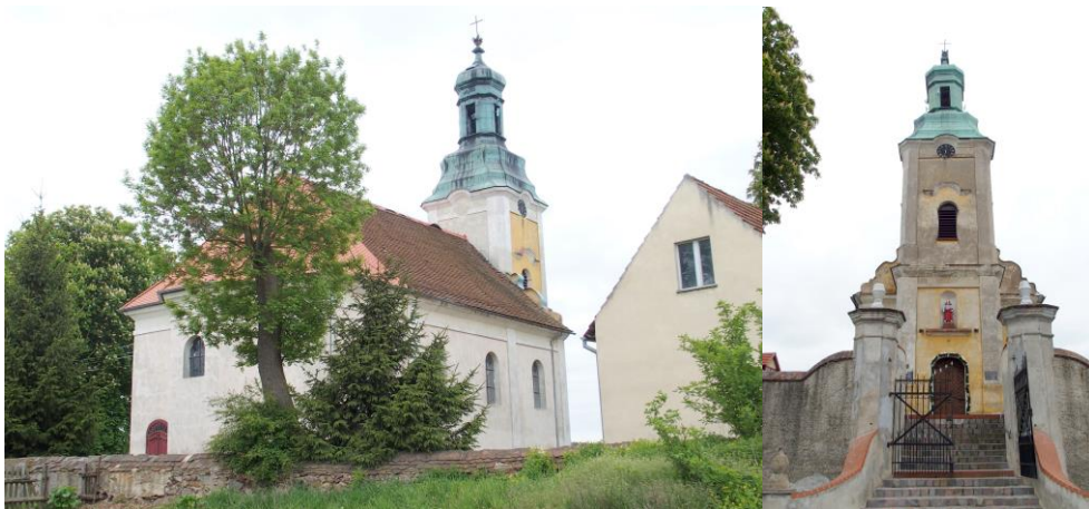
Zdjęcia nr 6, 7. Kościół ewangelicki, ob. filialny rzymskokatolicki pw. św. Anny w Nowej Wsi