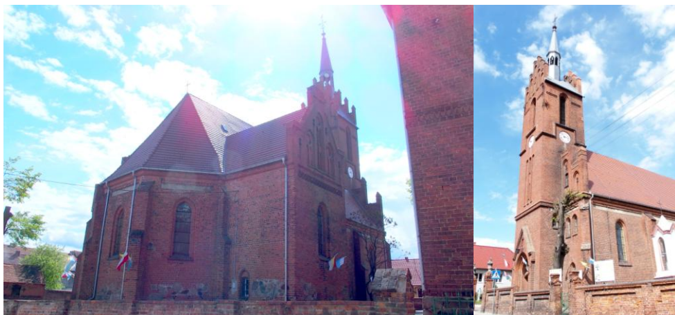
Zdjęcia nr 1, 2. Kościół parafialny pw. św. Katarzyny, ul. Kościuszki w Bledzewie

W 1212 r. wieś Bledzew, darował Cystersom ze Starego Dworku margrabia brandenburski Waldemar. Do Bledzewa przed 1418 r. przenieśli mnisi swą siedzibę z Zemsku i wtedy prawdopodobnie lokowali tam miasto. Dla kościoła parafialnego pw. św. Katarzyny, brak jest wszelkich materiałów w księgach biskupich i konsystorskich z XV i XVI w. Jest tylko nazwa tej parafii w Liber Benefitorum z 1510 r. oraz w rejestrze konstytucji z 1540 r. Kościół tutaj założono w XIV w.