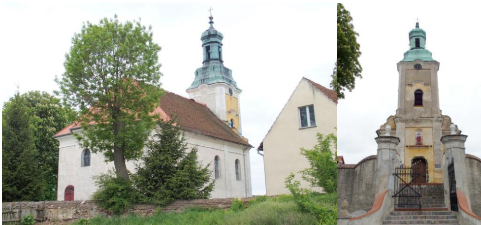
Zdjęcia nr 6, 7. Kościół ewangelicki, ob. filialny rzymskokatolicki pw. św. Anny w Nowej Wsi