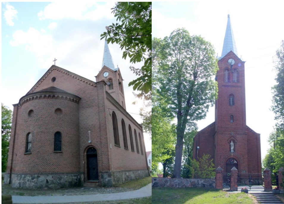
Zdjęcia nr 12, 13. Kościół ewangelicki, ob. parafialny rzymskokatolicki pw. Wniebowzięcia NMP w Sokolej Dąbrowie