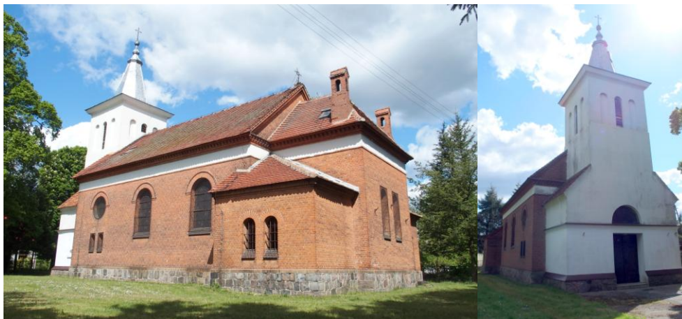
Zdjęcia nr 18, 19. Kościół ewangelicki, ob. filialny rzymskokatolicki pw. Zwiastowania NMP w Zemsku