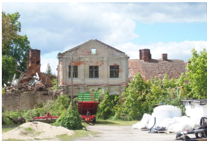
Zdjęcie nr 26. Rezydencja Opatów - dwór w Starym Dworku (nr 34)

Dwór położony jest w zachodniej części wsi, w sąsiedztwie zakola rzeki Obry, do której sięga park dworski. Dwór wraz z kościołem stojącym na nawsiu, pośrodku miejscowości, tworzy kompozycję osiową, niegdyś połączoną budynkiem wieży bramnej, rozebranej w początkach XX w. Wygląd wieży znany jest z opisu oraz skróconej inwentaryzacji wykonanej w 1903 r. Za dworem rozciągał się tarasowy ogród, przez co siedziba opatów w Starym Dworku urastała do rangi miniaturowej rezydencji reprezentacyjnej w typie entre cour et jardin , wzbogaconej bryłą kościoła.