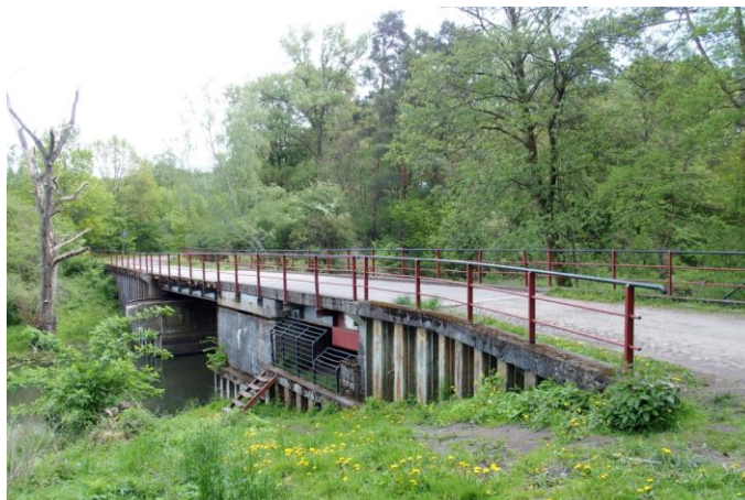
Zdjęcie nr 29. Most zwodzony - obrotowy D812 na Kanale Taktycznym 813 w Zespole Międzyrzeckiego Rejonu Umocnionego w Starym Dworku

Most w Starym Dworku o nazwie D 812, to jeden z dwóch mostów obrotowych w obrębie Międzyrzeckiego Rejonu Umocnionego. Ten rozbudowany system niemieckich fortyfikacji został stworzony w latach 1934 - 1944. Most jako jedyny w zespole MRU nie posiada przeszkód przeciwpancernych i schronów bojowych.