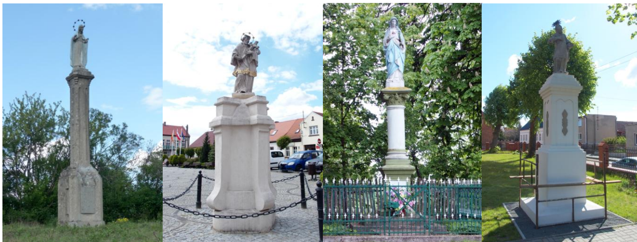
Zdjęcia nr 34, 35, 36, 37. Figury wolnostojące z terenu gminy Bledzew

Figury wolnostojące , czyli figury Chrystusa, Matki Bożej albo świętych ustawione na cokole. Niekiedy przybierają formę kolumn.