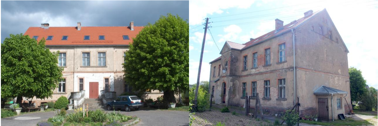
Zdjęcia nr 24, 25. Pałac w Osiecku (nr 65)

Pałac wraz z zabudową folwarczną i nieistniejącym dziś parkiem po północno - wschodniej stronie, znajduje się w centralnej części wsi, na wschód od kościoła. Fasadą zwrócony jest w stronę prostokątnego dziedzińca, przez który prowadzi dojazd do pałacu. Rozległy dziedziniec wyznaczają zabudowania gospodarcze, rozlokowane na jego skrajach.